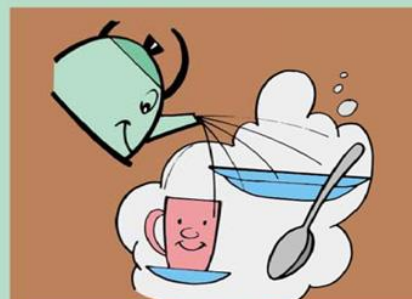
Выделите посуду больному