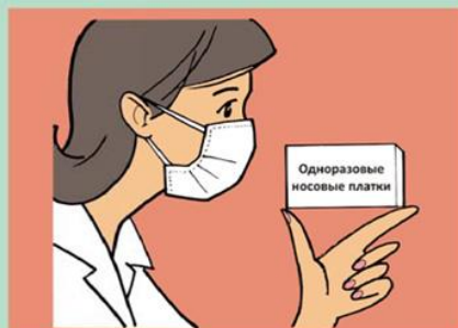
Используйте маски и одноразовые носовые платки