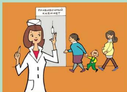
Своевременно вакцинируйтесь, беременные – с 14-ой недели