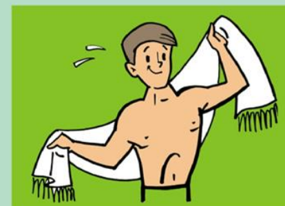
Закаляйтесь! Предупреждайте заболевания!