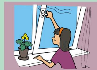
Часто проветривайте комнату