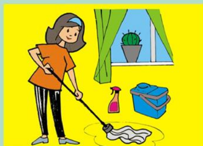
Ежедневно проводите влажную уборку