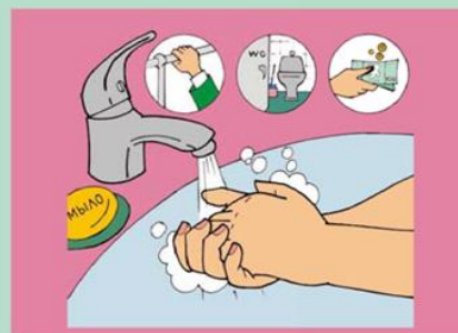
Регулярно мойте руки