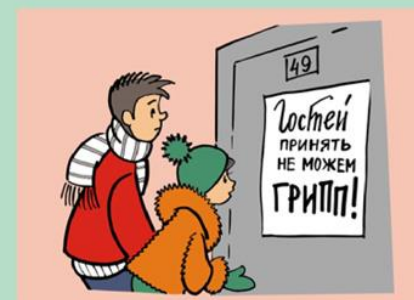
Ограничьте посещения массовых мероприятий